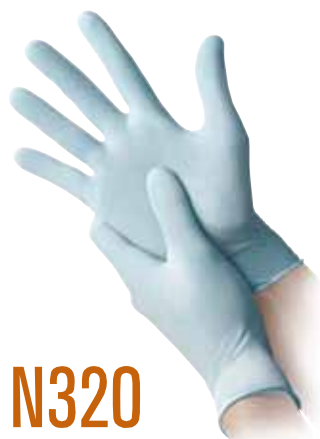
N320 NITRILE SENZA POLVERE NITRILE POWDER FREE

Spessore | Thickness: 0,10 mm Peso | Weight: 5,5 gr. Superficie | Surface: Micro ruvido - Micro Textured