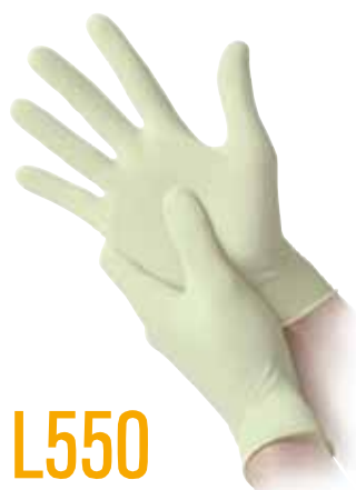
L550 LATTICE SENZA POLVERE LATEX POWDER FREE

COATS is the combination of colloidal oatmeal and disposable gloves resulting in products technologically advanced and officially recognized by American FDA as "skin protectors". COATS technology prevents irritation and dermatitis.